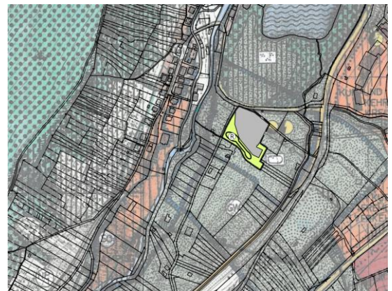
Vorgesehene Änderung Flächennutzungsplan