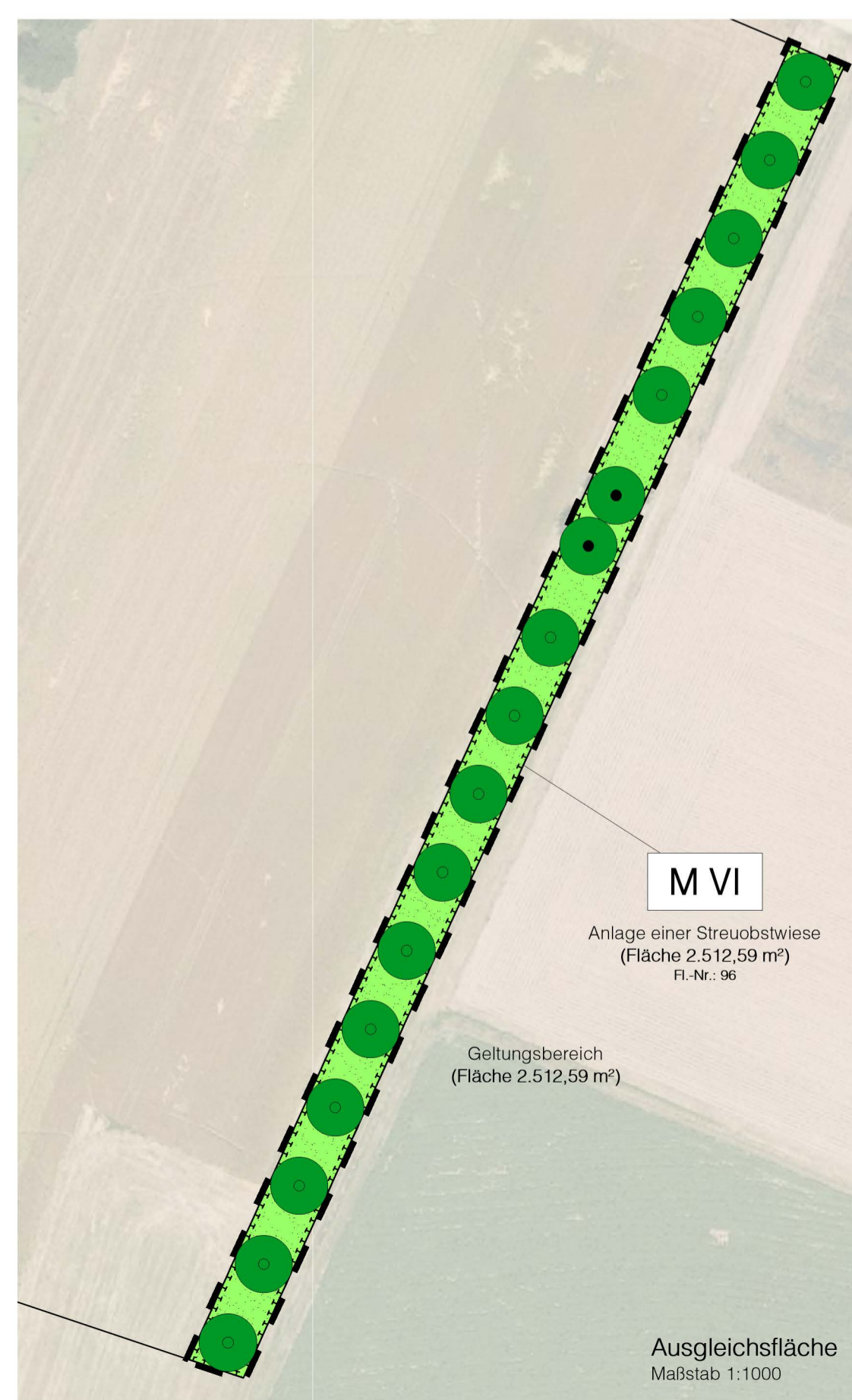
Ausgleichsfläche Maßstab 1:1000