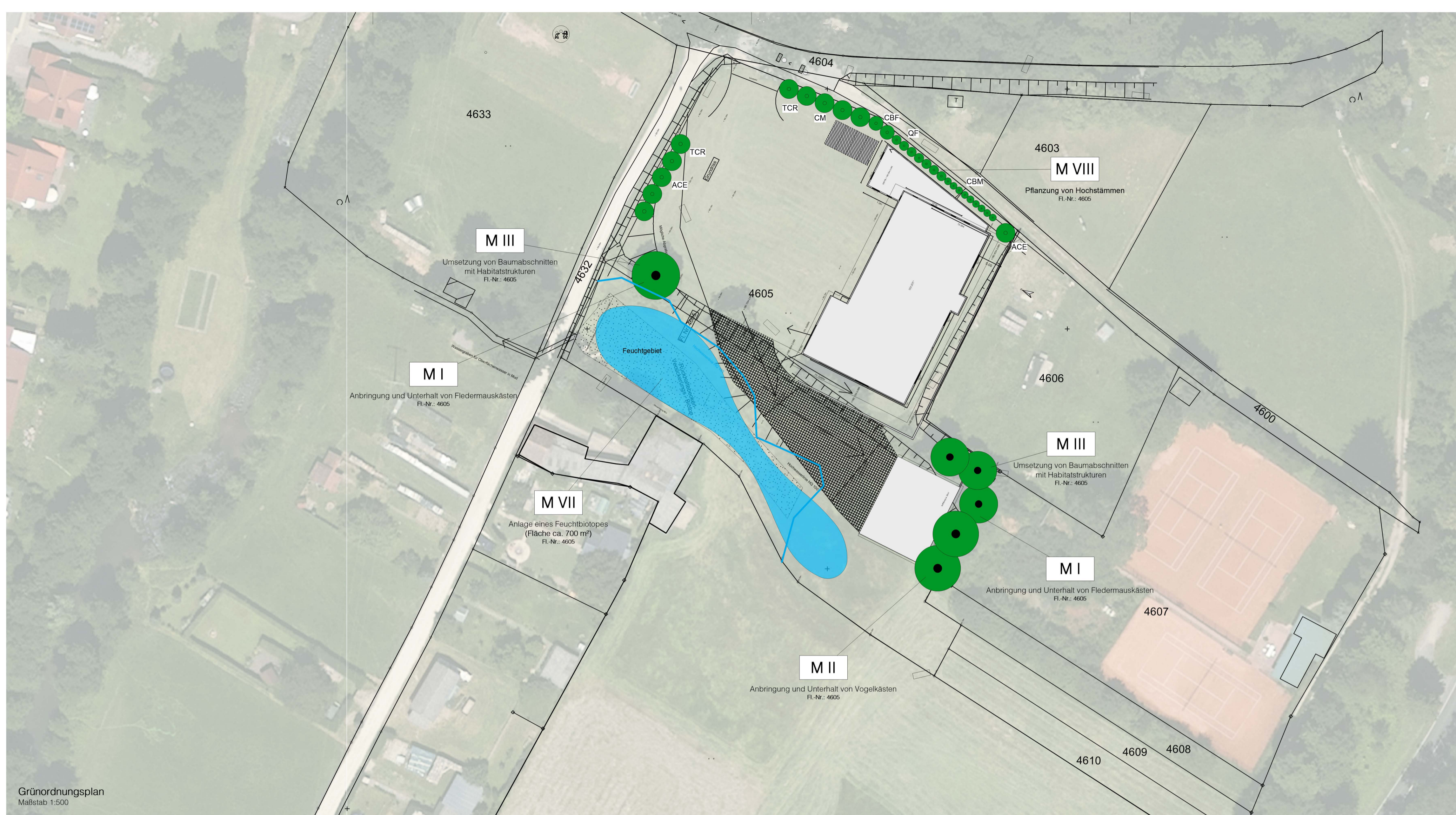
Grünordnungsplan Maßstab 1:500