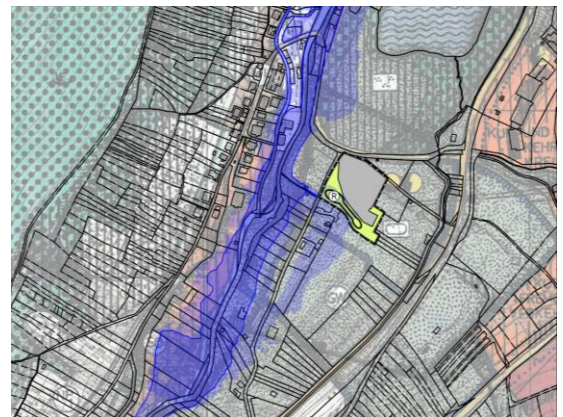
Vorgesehene Änderung Flächennutzungsplan