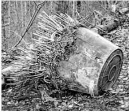
Unerlaubte Anlieferung auf dem Grüngutplatz Schneeberg

Aus gegebenem Anlass wird der Grüngutsammelplatz kameraüberwacht. Es ist nicht gestattet, etwas anderes als Grüngut aus den privaten Haushalten in Schneeberg anzuliefern. Auch Blumentöpfe und jegliche Pflanzbehälter sind vorher zu entfernen und über den Restmüll oder als Verpackungsmaterial zu entsorgen.