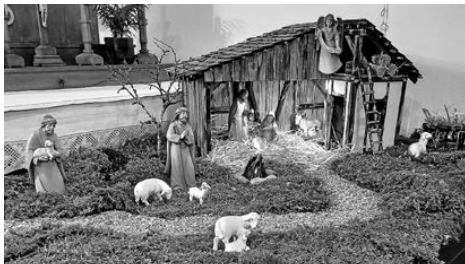
Neue Krippenfiguren für die Hambrunner Kirche

Pünktlich zum Beginn der Adventszeit wurde die neu gebaute Krippe und die zugehörige Krippenlandschaft fertig. So konnten nun die neuen Krippenfiguren ihren Platz einnehmen.